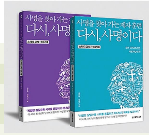
저서: 사명을 찾아가는 제자훈련-다시 사명이다. (생명의 말씀사, 2016)