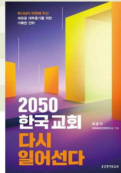
공동저서: 2050 한국교회 다시 일어선다. (생명의 말씀사, 2023)